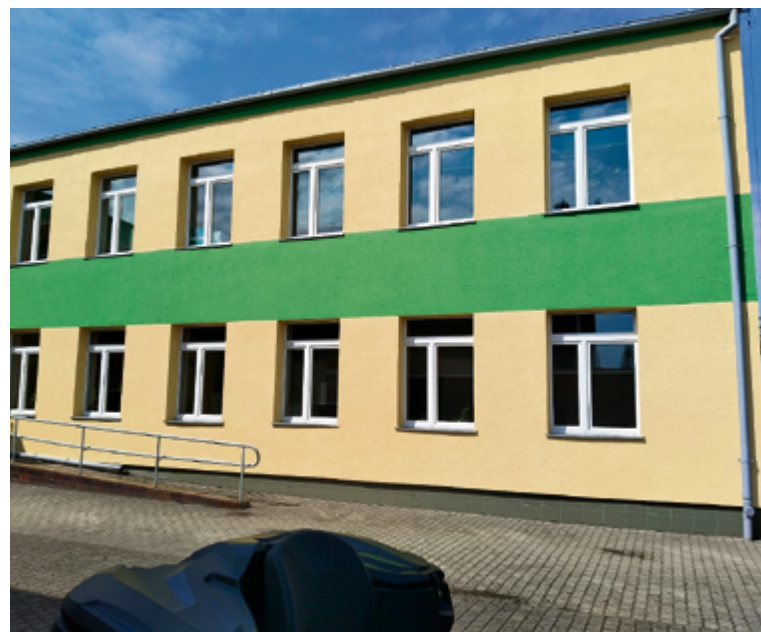
Odnowiona elewacja w SP w Złotkowie