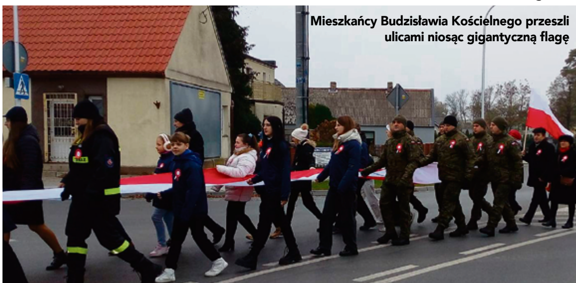
Mieszkańcy Budziszawie Kościelnego przeszli ulicami niosąc gigantyczną flagę