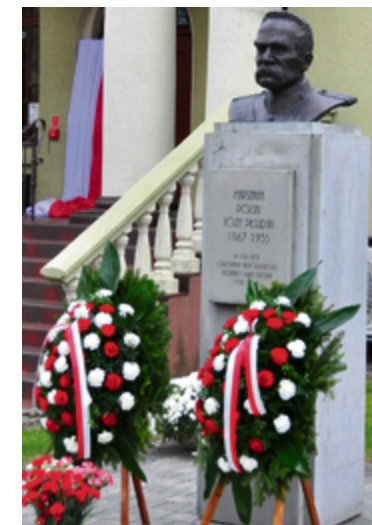
W Kleczewie delegacje złożyły kwiaty pod pomnikiem Marszałka Józefa Piłsudskiego