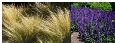
ostnica cieniuśka 'Pony Tails' połączona z szalwią omszoną