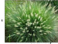
rozplenica japońska Hameln