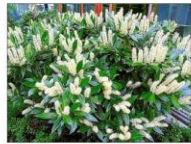
laurowśnia wschodnia Otto Luyken