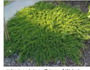
jałowiec płozący 'Prince of Wales'