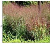
proso różgowe Rehbraun