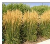
trzcinnik ostrokwiatowy Karl Foerster