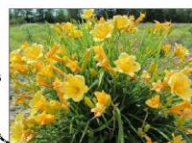
lilowiec 'Stella de Oro'