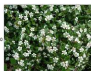
irga płoząca 'Coral Beauty'