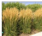
trzcinnik ostrokwiatowy Karl Foerster