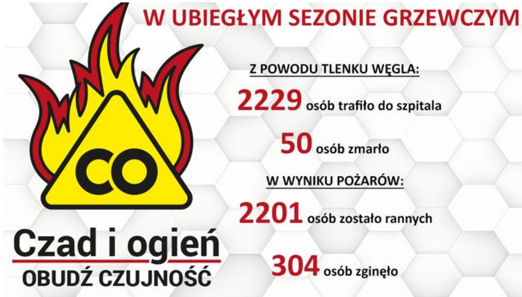
Rys. 5. Statystyka ofiar pożarów i zatruc tlenkiem węgla w sezonie grzewczym 2015/2016.